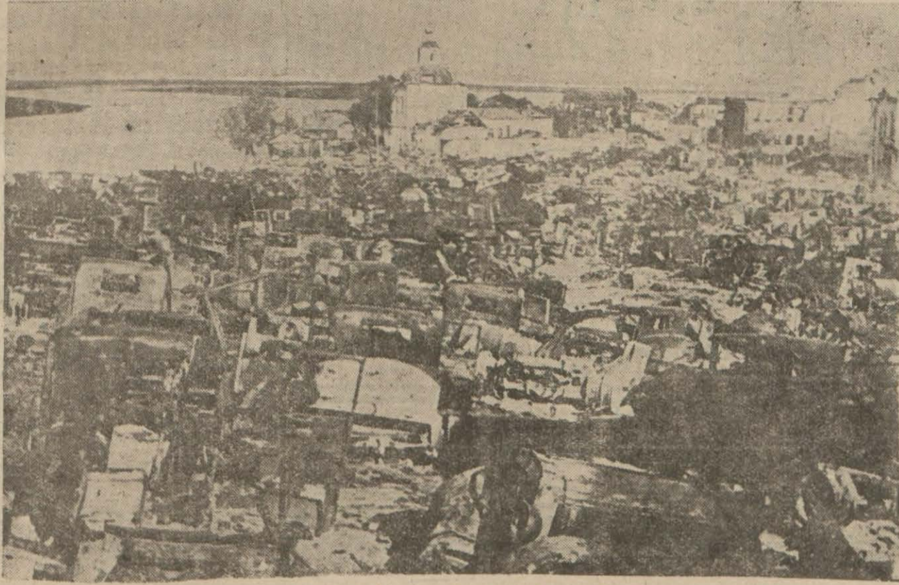
Don kıyılarında Sovyet ric'atinden mütevellid keşme keşi gösteren bir resim ..