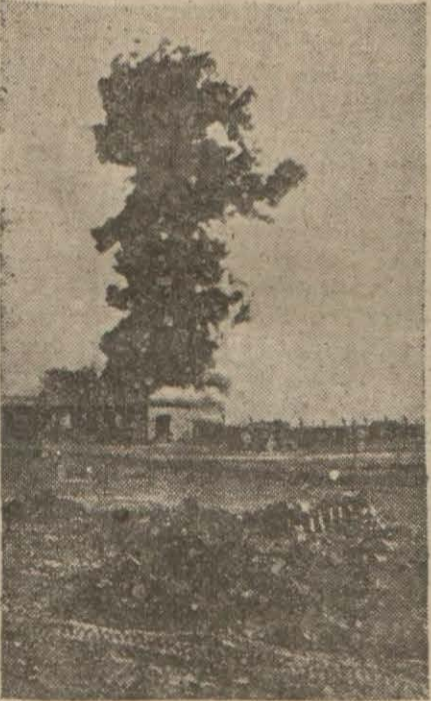
Mersa Matruh'da infilâk eden bir benzin deposu

Topçu ve hava kuvvetleri arasında çarpışmalar devam ediyor