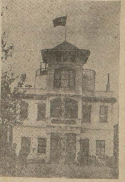
Balıkesir belediye binası

Balıkesir 25 (A.A.) — Ticaret Vekilimiz doktor Behçet Uz, bugün sabah saat 10 da beraberindeki zevatla, tayyare ile şehrimize gelmiştir. Otomobillerle doğrudan vîlâ-yete gelen vekil, komutanlık, parti ve belediye ziyareti sonra, vilâyette kaymakamlarla görüşmüş ve hükümetin son aldığı kararlarla bu yolda alınan tedbirler etrafında izahat almıştır. Doktor Behçet Uz, Balıkesir vilâyetinin hububat alımı kararına göre tesbit ve borçlandırma işinin süratle yapılması dolayısıyla memnuniyetlerini izhar ederek teşekkür etmiştir. Toplantı müteakib ofisin alım yerine gelen Vekil, orada mahsul teslim eden müstahşillerle görüşmüş ve alım vaziyetini tedkik ederek gereken direktifleri vermiştir. Vekilin şerefine Atatürk Park